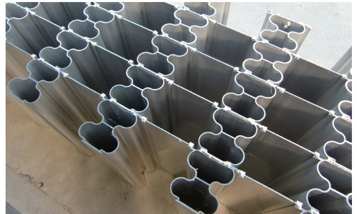
緩衝装置内部「8の字」緩衝材