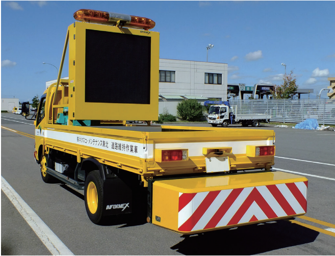
【装着例】自走式標識車